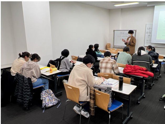
日本語の授業風景

予備教育達成度確認試験に合格した後は、いよいよ学部への進学を決めるQualifying Testが待っています。受験に向けて日々ハードスケジュールをこなしている予備教育履修生ですが、4月には学部課程を開始できるよう、教職員も全力でサポートしていきます。