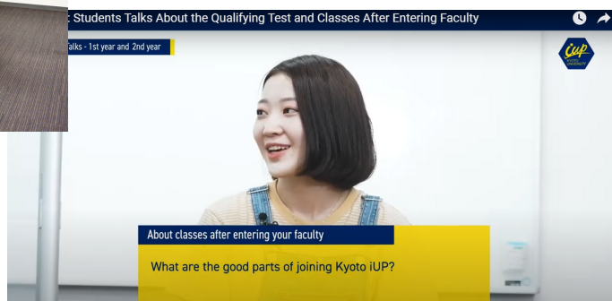
それぞれの経験を分かち合う