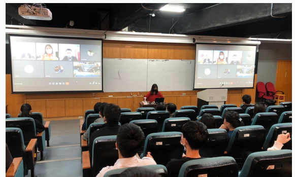
高校でセミナー参加する学生