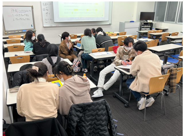
グループワークで学びを深める