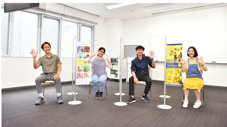
リラックスした雰囲気に対談するiUP生たち