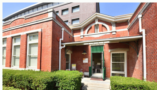
留学生ラウンジ「きずな」

建築学科の学年縦断講評会「Vertical Review」では日本語で発表し、個人賞を受賞しました!