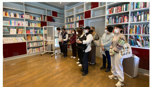
リーディングルーム

館内は主に2つの部屋、留学生アドバイジングサービスを受けられるサロンと語学学習用のリーディングルームに分かれています。まずサロンではアドバイザーから、自分一人では解決できない学修・生活上の様々な問題や悩みについて、予約不要で相談可能である旨の説明を受けました。